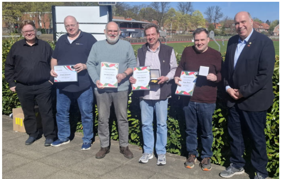
Geehrte beim Bezirkstag