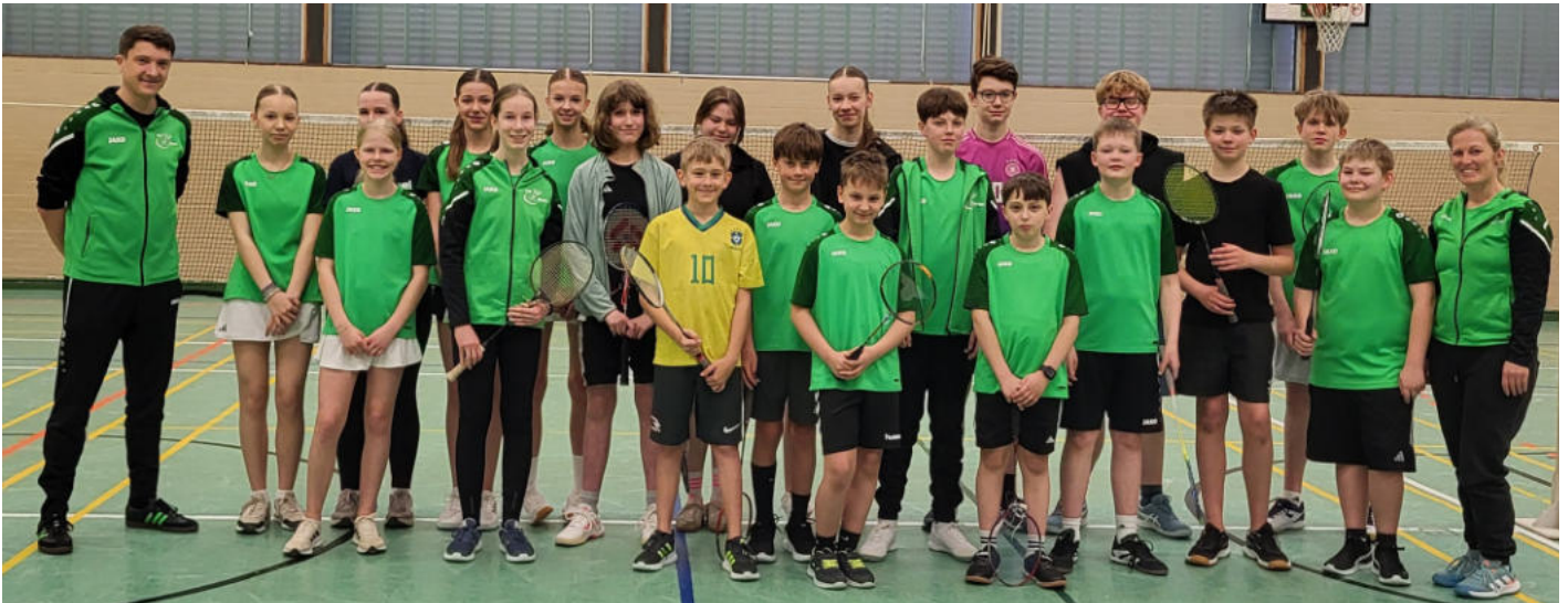
Teilnehmende an den Zevener Jugendvereinsmeisterschaften