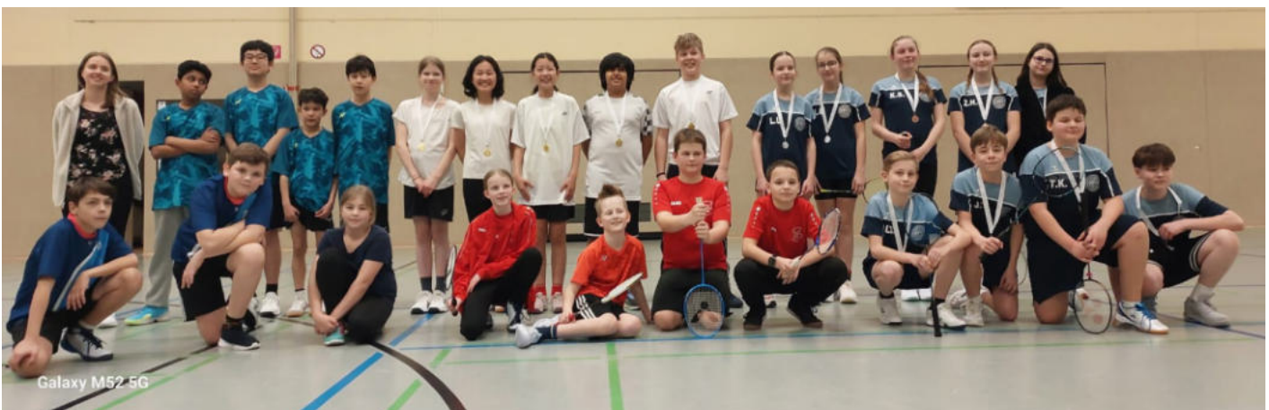
Bild oben: Teilnehmende an der Endrunde U13, Bild unten: Teilnehmende an der Endrunde U16

Insgesamt zeigte die Saison einmal mehr die gute Nachwuchsarbeit der Vereine im Bezirk Braunschweig und bot zahlreiche spannende und faire Begegnungen in allen Altersklassen.