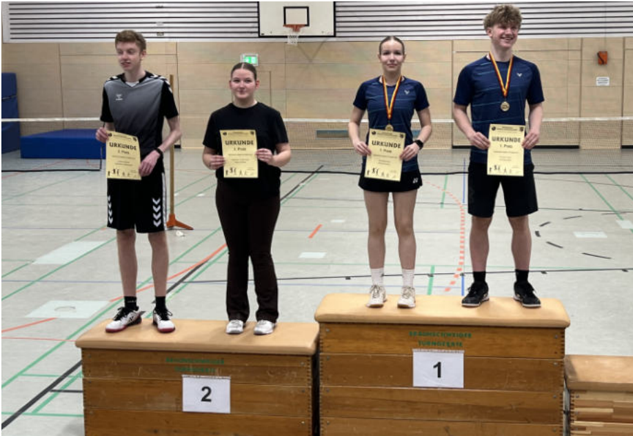
Siegerehrung GD U19

Die Platzierten der Stadtmeisterschaften Jugend: U9