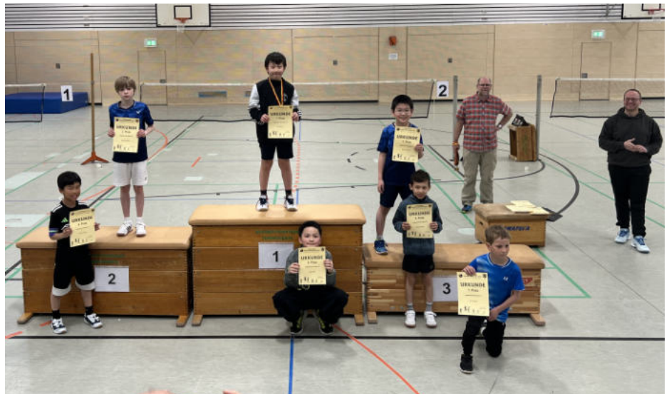
Siegerehrung JE U11